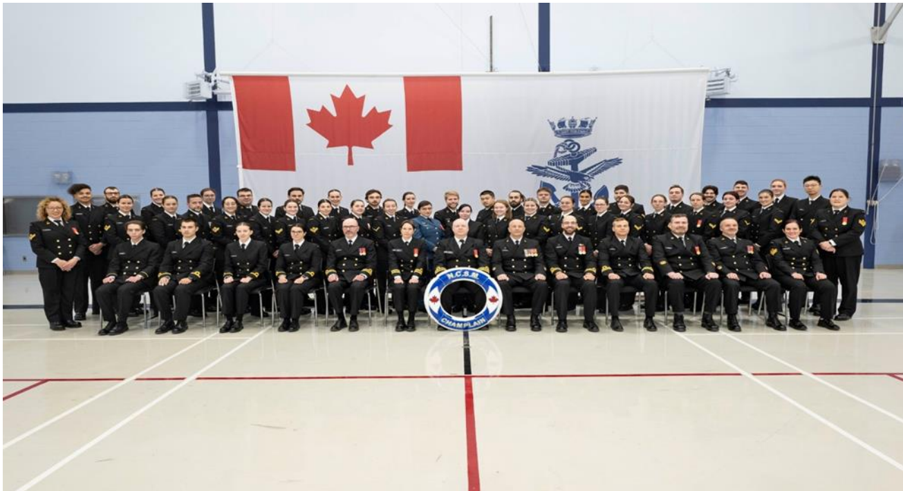
L'équipage du Champlain

Entraînement de navigation à bord d'une embarcation à coque rigide lors de l'Exercice Atlas tenu au NCSM Champlain le 1er octobre 2023.